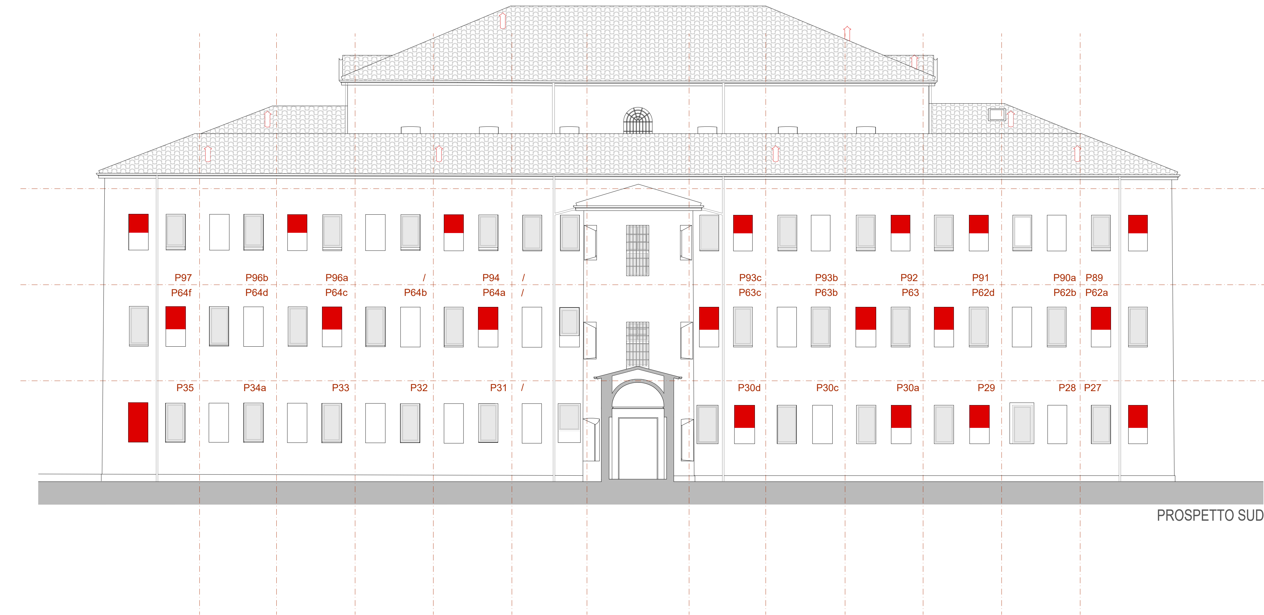
COMPARATIVA TRA VARIANTE 1 E VARIANTE 2 - Scala 1:100

(è stata mantenuta la numerazione originaria presente nello stato di fatto del progetto approvato, aggiungendo le lettere a, b, c, d quando il vano è stato suddiviso in più di una unità)